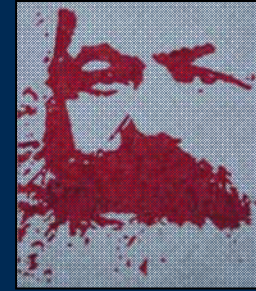
انجمن مارکس-حکمت لندن