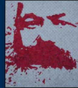
انجمن مارکس-حکمت لندن