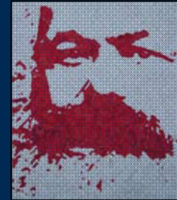
انجمن مارکس-حکمت لندن