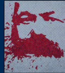
انجمن مارکس-حکمت لندن