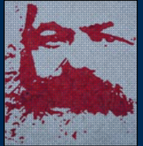
انجمن مارکس-حکمت لندن