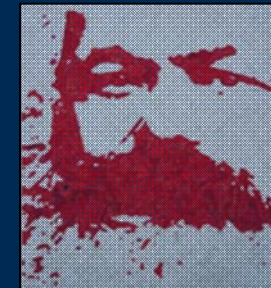
انجمن مارکس-حکمت لندن