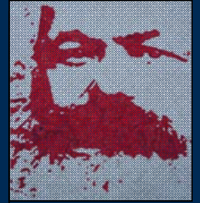
انجمن مارکس-حکمت لندن