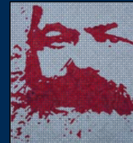
انجمن مارکس-حکمت لندن