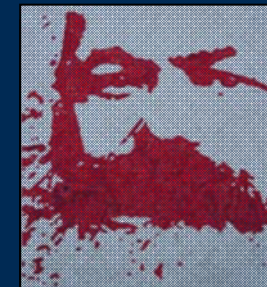
انجمن مارکس-حکمت لندن