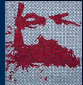
انجمن مارکس-حکمت لندن