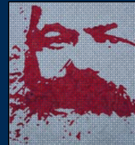
انجمن مارکس-حکمت لندن