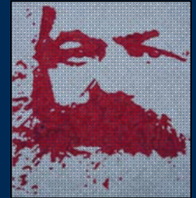
انجمن مارکس-حکمت لندن