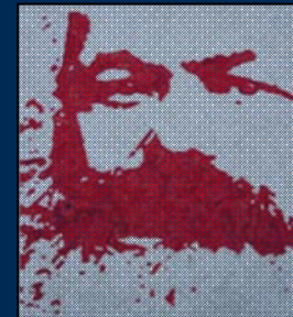
انجمن مارکس-حکمت لندن