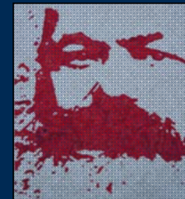
انجمن مارکس-حکمت لندن

دوران خاتمه قطعی انقلاب و تثبیت سیاسی جمهوری اسلامی