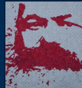
انجمن مارکس-حکمت لندن