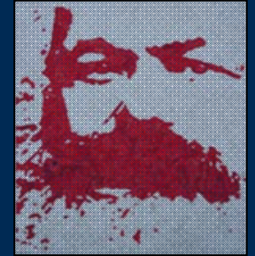
انجمن مارکس-حکمت لندن