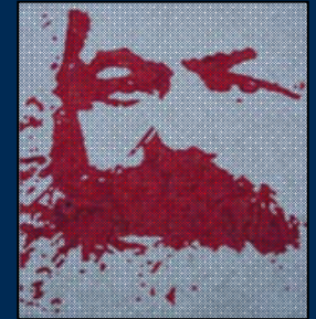
انجمن مارکس-حکمت لندن