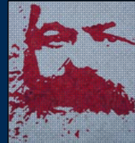
انجمن مارکس-حکمت لندن