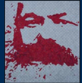
انجمن مارکس-حکمت لندن